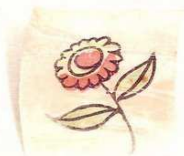
ilustração: Ana Raquel